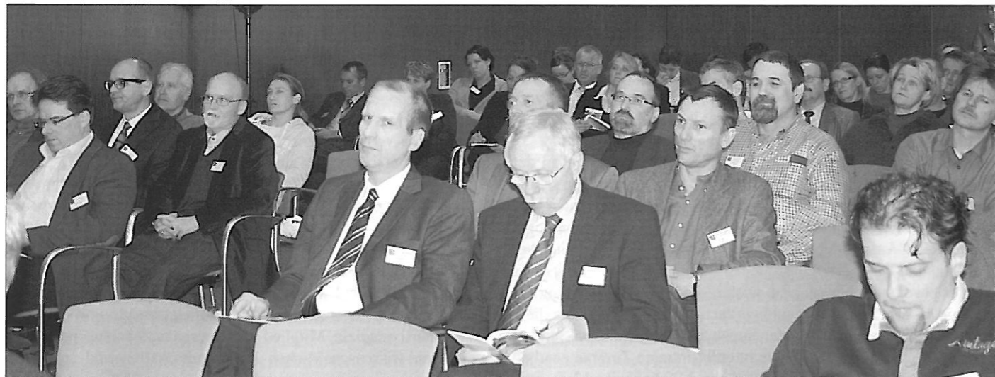
Teilnehmer des Fachsymposiums