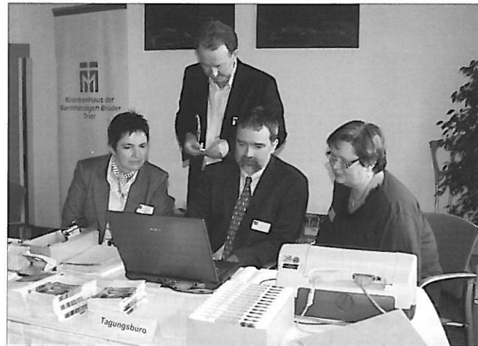
Letzte Kongressvorbereitungen im Tagungsbüro

Die Allgemein-, Viszeral- und Gefäßchirurgie ist als eine der großen Abteilungen des Brüderkrankenhauses Schnittstelle für verschiedene Zentren (Zentrum für Gefäßmedizin, Darmzentrum,