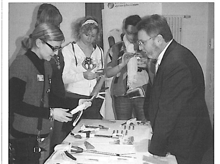
Aktuelles Wissen über Klammernahttechniken und Instrumente